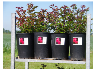
rozen in pot