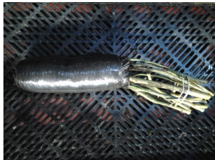
roos met verpakte wortels