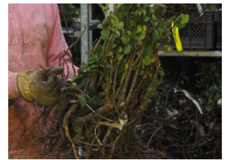
rozen op kale wortel