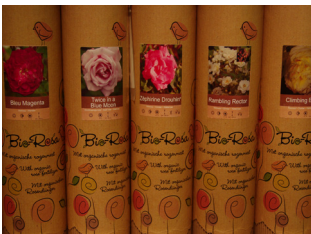
Rooskado: roos met verpakte wortels in kadoverpakking

Hartelijk gefeliciteerd met de aankoop van uw rozen! U krijgt het eerste groeiseizoen garantie. Daarom is het van belang dat u de plantinstructies goed opvolgt. Neem de tijd om de volgende tips te lezen. Want wie rozen goed plant en verzorgt, kan er een leven lang van genieten. En misschien uw kleinkinderen ook nog!